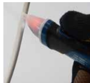
電源ONで緑色、 電圧検出で赤色に点灯