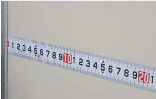
機械・設備の補助目盛に