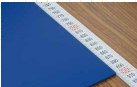
製品品質検査確認作業に