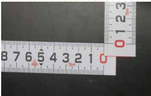
作業台の基準目盛に